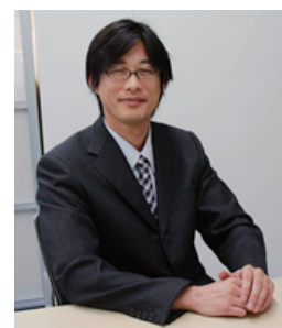
地方通信事業者にて、広域 IP 通信網や VPN 等を利用した高セキュリティ通信網の設計や構築と運用等に、技術責任者として従事。退職後、インクレイブ株式会社に入社し、自社製品の開発や、プライバシマークの取得推進、IT 開発センター/R&D の立ち上げ等を経て、2012 年 4 月、インクレイブ R&D 株式会社の代表取締役役に就任

この新しい開発体制を持って、お客様や社会のご期待に応じてゆくとともに、先進性の高い独創的で革新的な技術へのチャレンジを行うことで、ICT 技術とデザインが高次元で融合された新しい製品&サービスをインクレイブ株式会社に供給し続けてまいります。